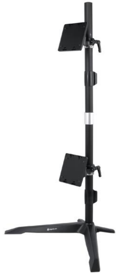
機種名稱:EGTS012Q 圖面日期:2022/02/07(D)